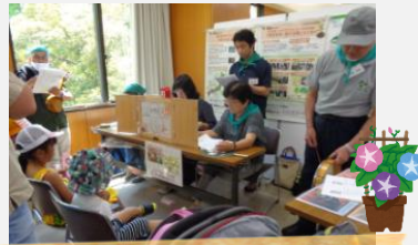
地球緑化センター

中央区開催の第11回『エコまつり』に出展し、5つの環境活動団体と一緒にパネル展示、クイズ、ワークショップ等を行いました。天候にも恵まれたたくさんの方々にご来場いただきました。