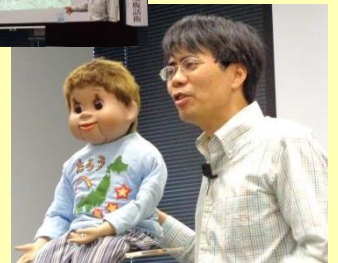
▲エコロジーさんとたろうくん