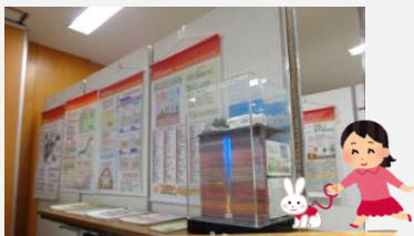
地中熱利用促進協会

私たちは、日本で最初に有機食品の認証業務を開始した「第三者・オーガニック認証機関」です。環境負荷の軽減と食品の安全性を確保するため、有機食品の認証業務に取り組んでいます。国内の有機農業生産団体などと協力して、人々の健康増進と持続可能な社会の構築を目指しています。