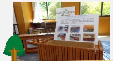
中央区森の応援団

小学生を対象とした、わくわく・すいすい「水辺探検」のワークショップの作品を紹介しました。本年実施分の参加希望は『まちふねみらい塾』(03-6264-8177)までお問い合わせください。