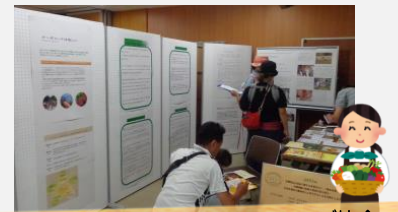
日本オーガニック&ナチュラルフーズ協会 (通称: JONA)

緑のボランティアを育て、その活動を応援する団体です。次世代を担う子どもたちに身近に緑を感じてほしいとの想いを込めた環境教育を行っています。当日は、森をテーマにした紙芝居を「語り部」で上演し、立ち寄ったたくさんのお子どもたちは紙芝居に真剣に耳を傾けてくれました。