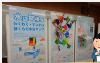
まちふね みらい塾

「地中熱」は日本全国どこでもあなたの足元にある、とても身近なエネルギーです。エコまつりでは、節電・省エネやヒートアイランド現象の緩和にも役立つ地中熱利用の仕組みを、模型とパネルを見ながら紹介しました。