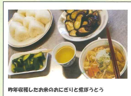
昨年収穫したお米のおにぎり煮ぼうとう