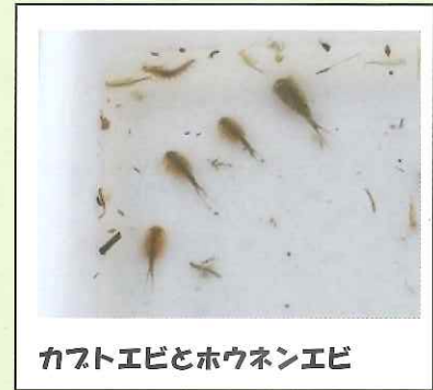
カブトエビとホウネンエビ