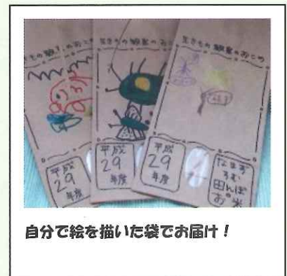
自分で絵を描いた袋でお届け！